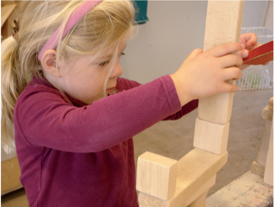
Fra fascination til fordybelse